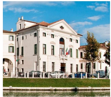
TREVISO Palazzo Giacomelli Piazza Garibaldi, 13